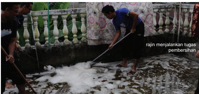
rajin menjalankan tugas pembersihan

struktur rumah bersama kontraktor yang telah dilantik. Antara tugas lain termasuklah kerja-kerja baik pulih longkang, menyusun atur kedudukan pasu bunga dan pembersihan najis arnab di bahagian dalam rumah.