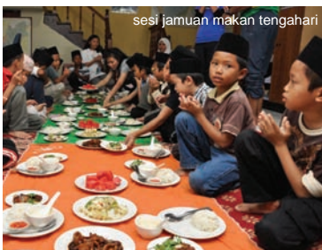
sesi jamuan makan tengahari

Kumpulan kedua bertanggungjawab untuk kerja-kerja pembersihan di dalam dan persekitaran rumah manakala kumpulan ketiga bertanggungjawab untuk kerja-kerja membaiki