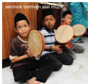
seronok bermain alat muzik